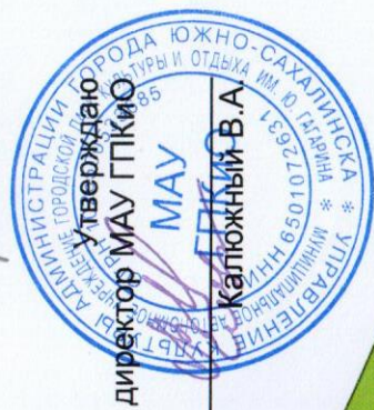
Схема на ярмарку с 02.04.18 по 20.05.18